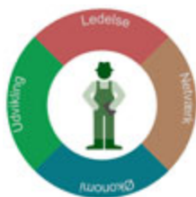
Ledelse af virksomheden