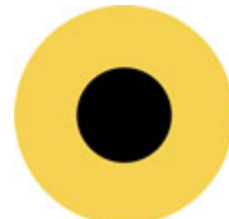
Inspiration til din ledelse