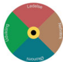
Ledelsesmodeller og -værktøjer